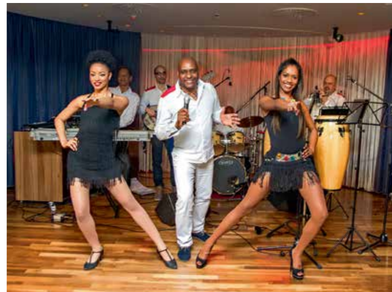
“Salsa y Punto” Концерт групе кубанских музичара (27. мај)